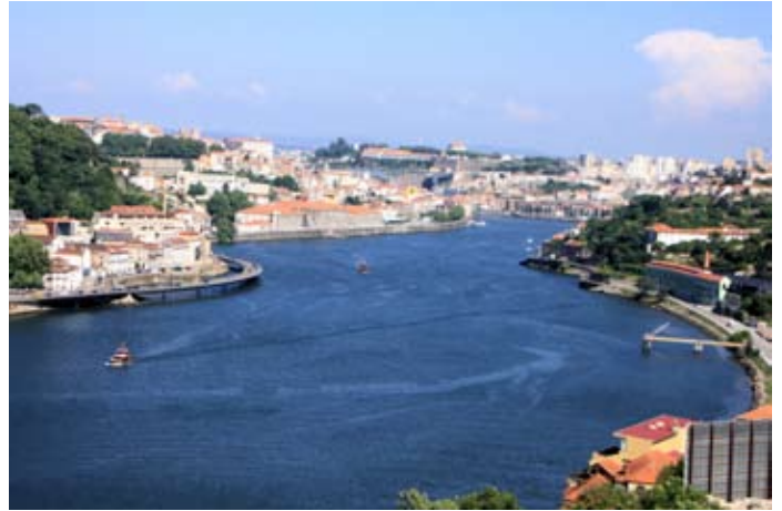
Porto liegt am Douro vor dessen Mündung in den Atlantik

Hügelstadt aus Granit – grau, geheimnisvoll und vielseitig. Ein Besuch der Börse steht ebenso auf dem Programm wie das quirlige Altstadtviertel Ribeira und eine Weinprobe in einer der zahlreichen Portweinkellereien. Abendessen und Übernachtung im Hotel in Porto. Hotel Ipanema Porto**** (angefragt)